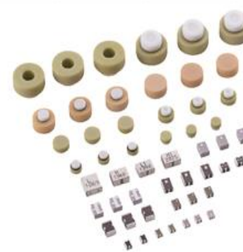
LTCC Chip Antennas